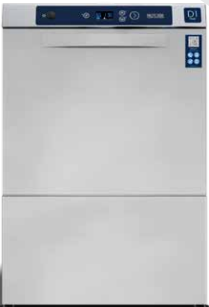
D1 Core Pöydäanaluskone